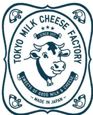
東京ミルクチーズ工場

厳選したミルク、良質のチーズ、お菓子職人たちが、日本中、世界中から集めてきた材料でこれまでにない自分たちにしか作れないお菓子を作りたい… 東京ミルクチーズ工場は、新しい材料の組み合わせをまいにち考え驚きとおいしいお菓子を提供する創造性あふれる工場をコンセプトにしています。