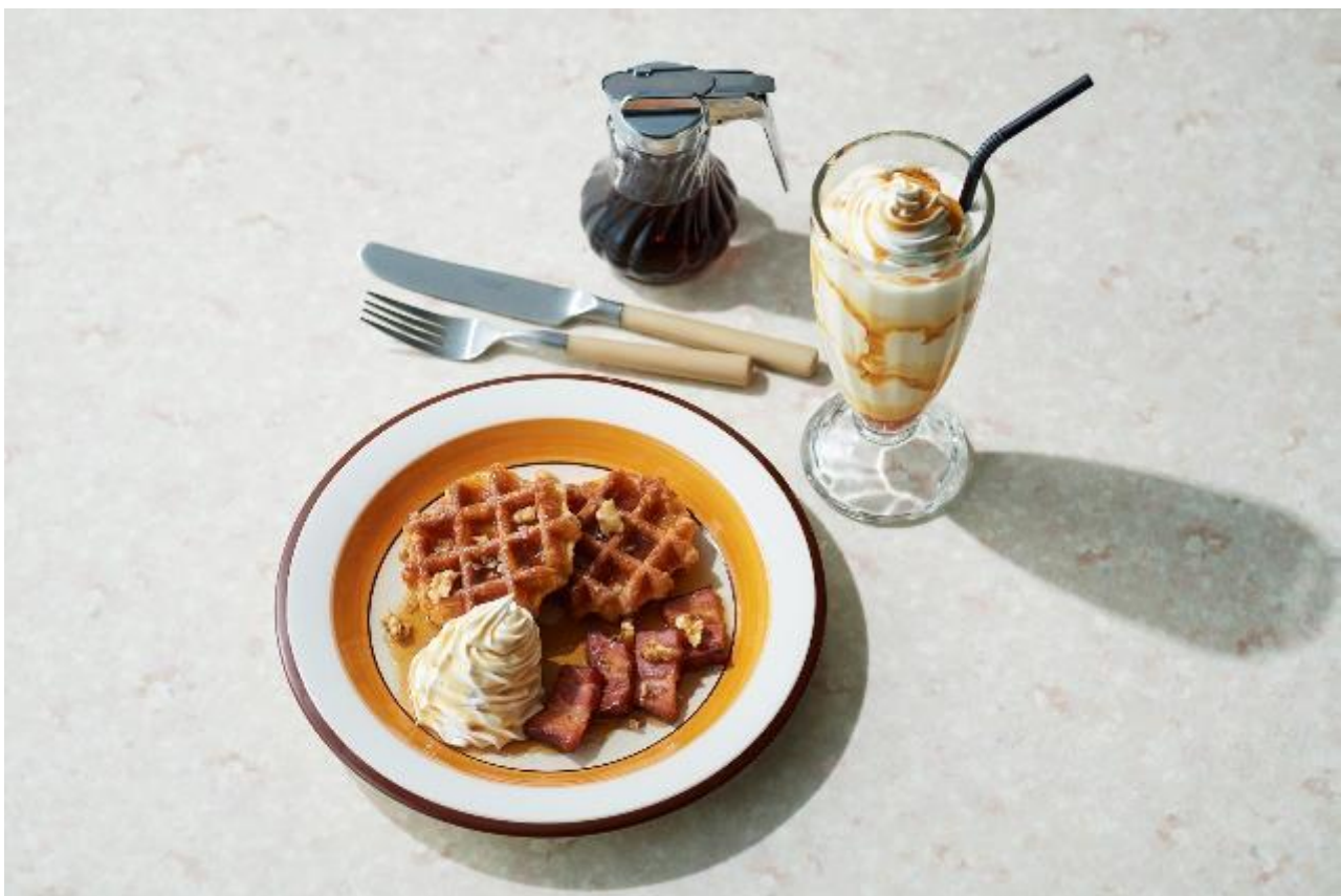
メイプルダイナープレート シェイクセット 1,000円（税抜）