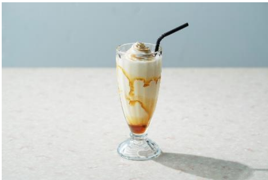
メープルシェイク 500円（税抜）

【本件に関する報道関係者からのお問合せ先】 株式会社シュクレイ 企画開発部 宛 メールアドレス： info@sucrey.co.jp 電話番号：0120-39-8507