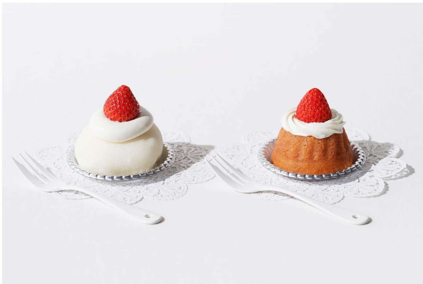
（写真左） いちご大福

表参道店では、ふだんを少し色付けてくれるような、いちごケーキ、いちご大福、いちごをたっぷりを使用した焼菓子をご用意しています。