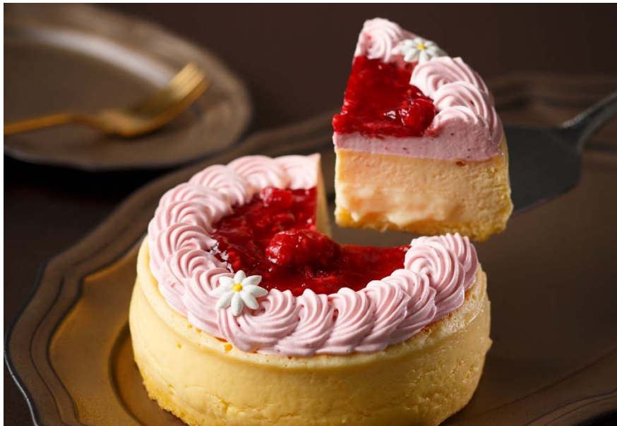
【商品名】 ベリーベリーカスタード 【サイズ/価格】 直径12cm 1,944円（税込）

博多あまおう苺のクリームと果肉たっぷりの甘酸っぱいベリーソースの下には、たっぷりのカスタードクリームを閉じ込めています。