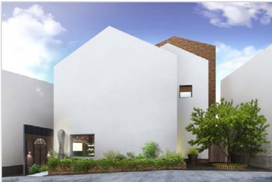
外観：アイスクリームの国、山脈をイメージ。白壁と、大きな「スノーインサマー」という木が目印となります。

また2階には「サロン・ド・テ」と呼ばれるカフェを併設。アントルメグラスセや生グラスはもちろんのこと、常広「ランチョ・エルパソ」のソーセージをはじめ、クロックマダムやキッシュまでご用意しています。1日限定20食のランチコースもあります。