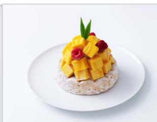
【マンゴーパッション】

フランスを代表するお菓子フレンチエをフランボワーズ(木いちご)とバニラアイス、ダックワーズ生地で作りました。シンプルながら定番のアントルメグラッセ。