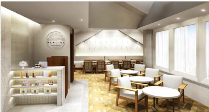
2F：サロン・ド・テ／開放感がある2Fはパーティもできる個室もご用意。

※現在建設中です。一部建築バース表現と異なる場合もございますのでご了承くださいませ