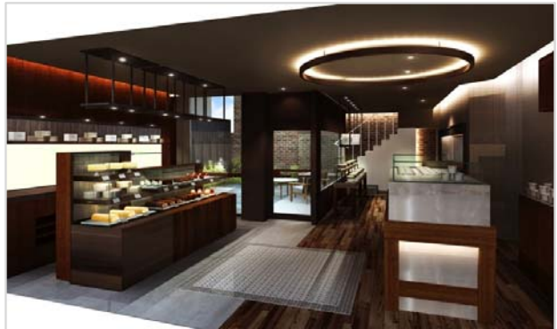
1F：LeTAOプロデュースのもと、アントルメグラスセをはじめ、生グラス、洋菓子、生菓子をご用意。また実際にアントルメグラスセを作っている様子を見ることができます。