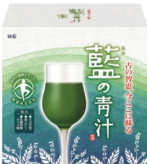
△純藍 新商品「藍の青汁」

この状況を受け、純藍株式会社では、野菜不足を手軽に美味しく補うだけでなく「アンチエイジング機能」や「整腸機能」をプラスした『藍の青汁』を開発いたしました。